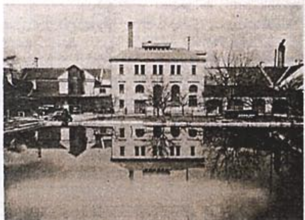
ZA PRVNÍ REPUBLIKY. Rychnovský pivovar v dobách své největší slávy. Vlevo celkový pohled na nádvoří s pivovarským rybníkem, uprostřed křížová klenba v bývalém zámeckém objektu, vpravo vystoupení rychnovských hasičů na pivovarském nádvoří.

Běleč nad Orlicí Pivovar a hostinec U Hušků Dětenice Zámecký pivovar Dobruška Staročeský pivovár Rampoušák Dráček nad Labem Pivovar Tambor Hradeč Králové Pivovar Rambousek Miletín Pivovar U bojště 1866 Vrchlabí Pivovarská bašta